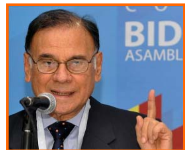
Minister van Economische Zaken Alí Rodríguez

Het internationaal monetair fonds (IMF) schat dat de inflatie dit jaar 36% zal zijn. De inflatie voor 2010 wordt nog hoger geschat, namelijk op 43,5%. Volgens de centrale bank van Venezuela is de gecumuleerde inflatie dit jaar tot en met augustus 15,6 procent. De inflatie zou echter langzaam afnemen. In juni was de inflatie 2,2%, in juli 2,1% en in augustus 0,4%. Minister van Economische Zaken Alí Rodríguez schat het inflatiecijfer ook lager in, namelijk op 26% voor 2009. Hij volgt hierbij de centrale bank.